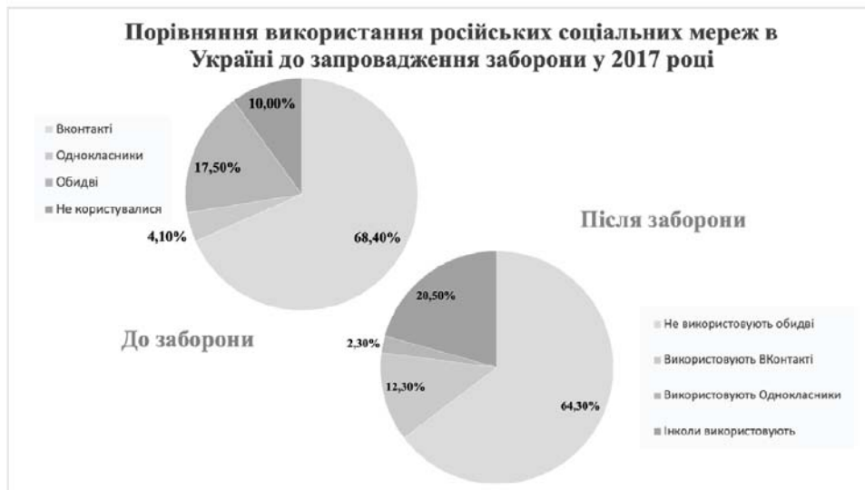
Рис. 2. Порівняння використання російських соціальних мереж в Україні до запровадження заборони у 2017 році

Водночас 53,8 % опитаних позитивно ставляться до заборони російських соціальних мереж, 33,9 % – нейтрально, 10,5 % – негативно, 1,8 % респондентів нічого не знають про заборону.