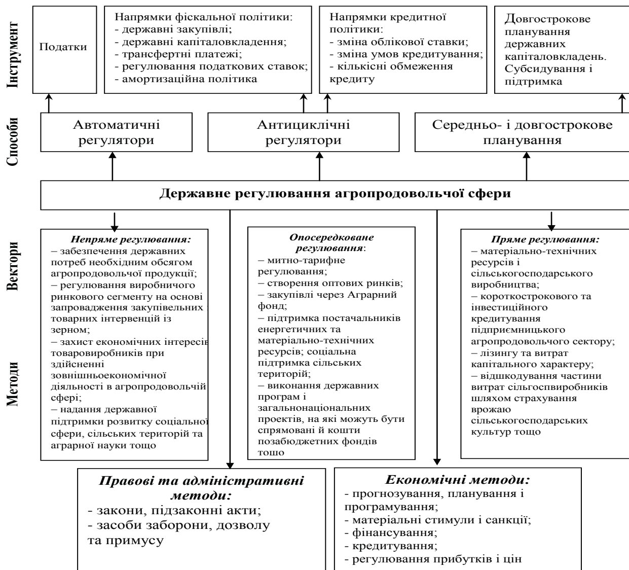
Рис. 1. Державне регулювання агропродовольчої сфери * Джерело: побудовано автором за допомогою [1; 3]

До головних опосередкованих векторів реалізації державної підтримки відносяться: